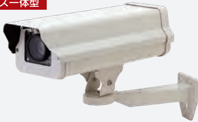
TIC-408FXHS 標準価格 ¥150,000(税別) TIC-408FX2HS 標準価格 ¥180,000(税別)