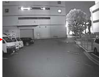
白黒映像(赤外線照射+電子感度UP)