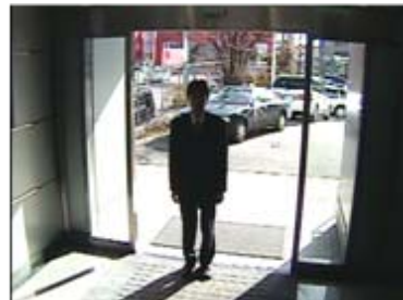
通常のカメラ映像