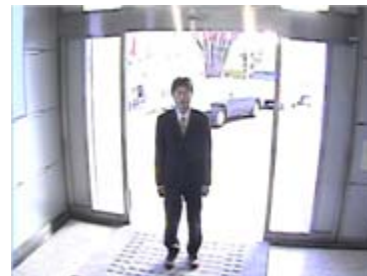
逆光補正ON時のカメラ映像