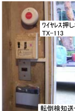
ワイヤレス押しボタン送信機 TX-113