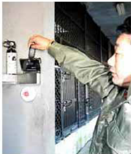
京都市動物園の各動物舎に設置された警報発信機（京都市左京区）