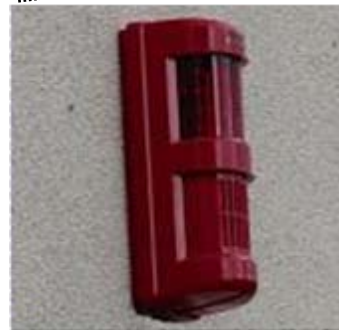
フラッシュ・サイレン付受信機:RX-25AR